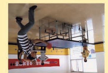
青春节拍 我运动,我快乐——记2004年乒乓球全员对抗赛