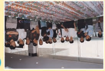
港区沙盘模型问世 由公司上下集思广益,公关科精心策划,专业人士精心制作的FICT-5号泊位总体规划沙盘模型出世啦。那广袤的堆场、整齐摆放的集装箱、新一代的大型船舶、繁忙的码头作业场面,这一切不正是我们不懈努力的目标吗?沙盘模型的建成不仅成了员工加油鼓劲的动力,加深了来访船公司等客户的视觉印象,更增强了对FICT发展潜力的信心。